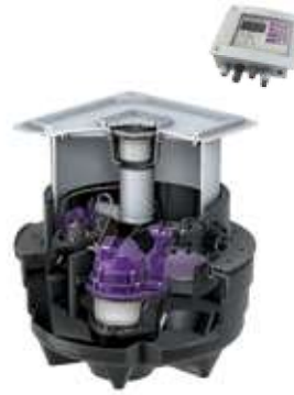
На иллюстрации исполнение Mono 28 701X