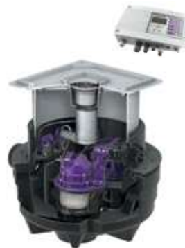
На иллюстрации: исполнение Duo 28 704X